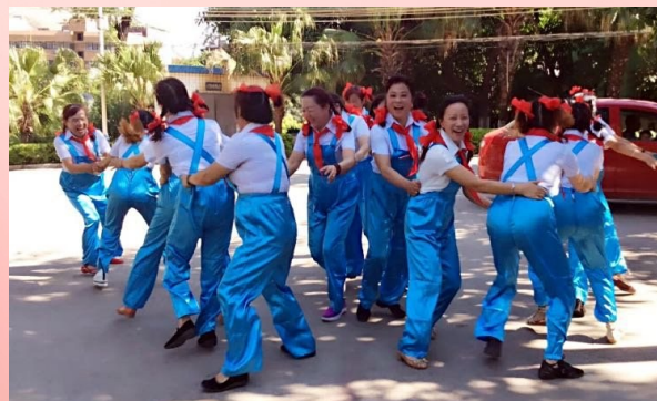
我们的节日:“老顽童过节” (作品人:知足)