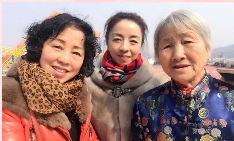
春暖花开,阳光明媚,姐妹陪伴81岁的老母亲享受着美好生活。祝福天下所有的母亲健康长寿!