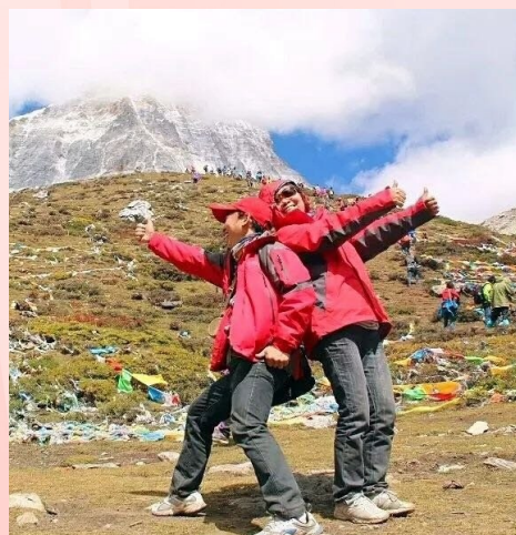
幸福家庭:夫唱妇随 (作品人:张秀凤)