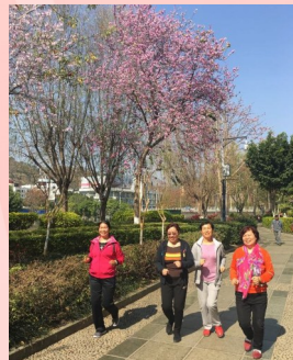
阳光花城,快乐女人。