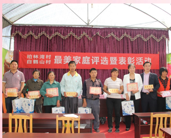
▲巴中市巴州区村级最美家庭评选活动