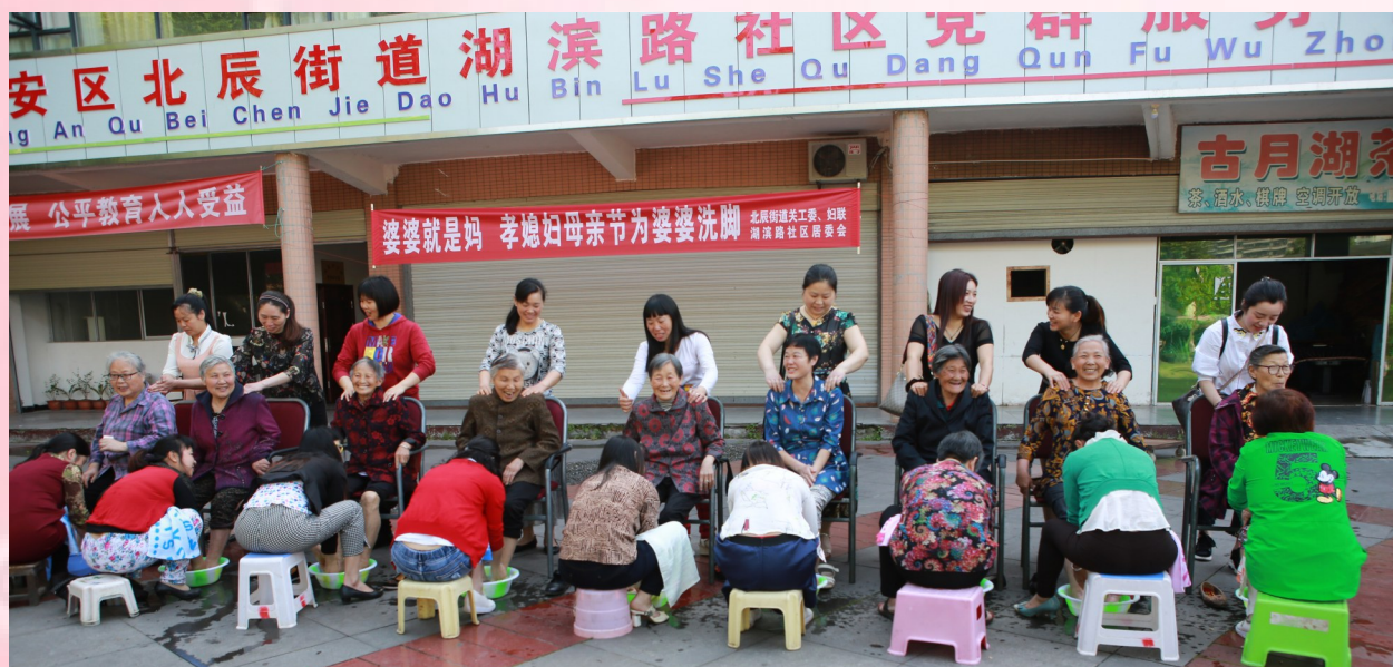
▲为弘扬孝老爱亲正能量,5月13日,四川省广安市广安区北辰街道妇联、关工委、工会联合湖滨路社区举行“婆婆就是我亲妈,孝媳母亲节为婆婆洗脚”活动。在活动现场,9位孝媳为自己的婆婆洗脚、剪脚趾甲。