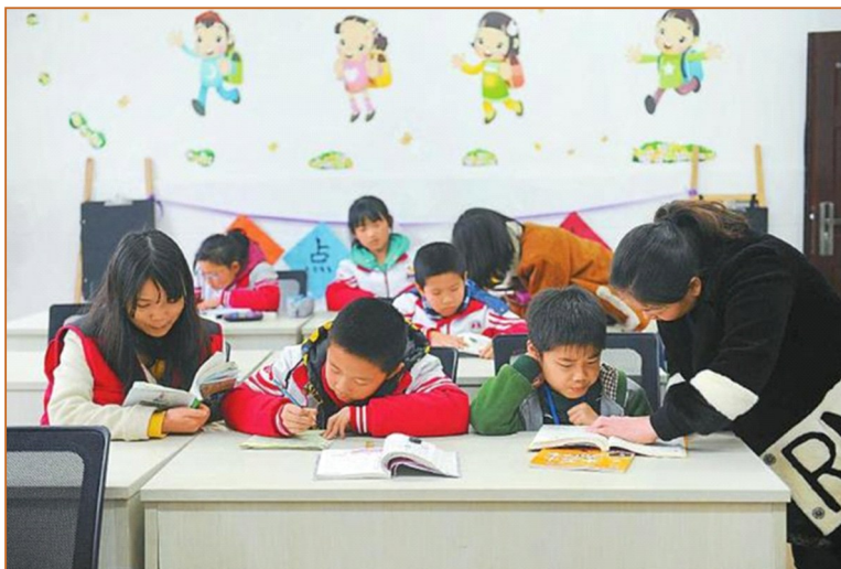
社工为当地留守儿童辅导作业。

今年开始,四川在之前大量工作的基础上,启动农村留守儿童“合力监护、相伴成长”关爱保护专项行动,着力探索一条适合我省实际的农村留守儿童关爱保护工作新思路、新办法、新路子。在我省较早开展留守儿童保护关爱工作的仁寿县,记者进行了一番实地调查。