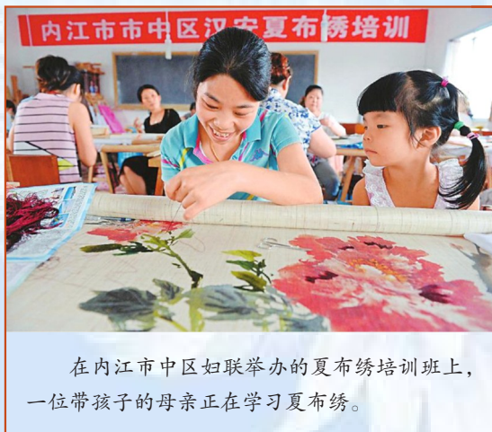
在内江市中区妇联举办的夏布绣培训班上,一位带孩子的母亲正在学习夏布绣。