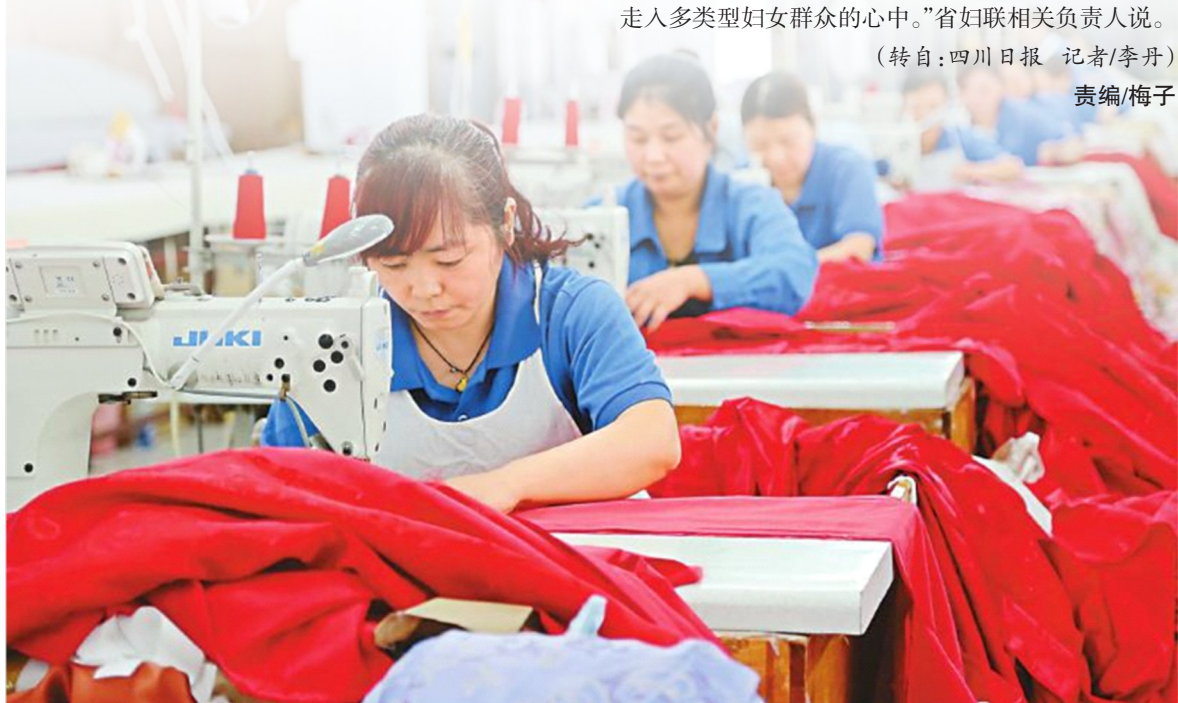
6月16日,女工们在南充市嘉陵区吉安镇妇女居家灵活就业点工作。