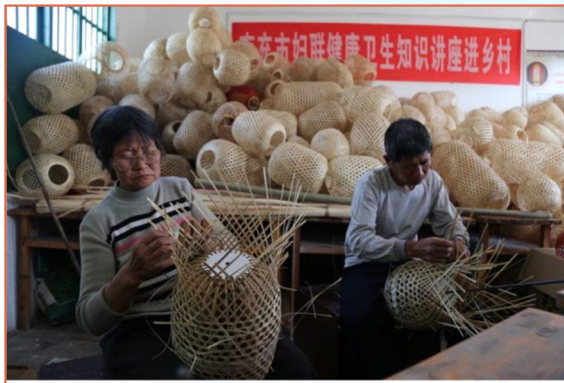
打造竹编生产基地

4月19日下午,中央及省级媒体“走基层、访妇情”大型采访活动来到南充市高坪区石圭镇壁山村,看南充市妇联如何用“绣花”功夫,凝聚各方女性力量,帮助壁山村拔掉穷根,变了模样。