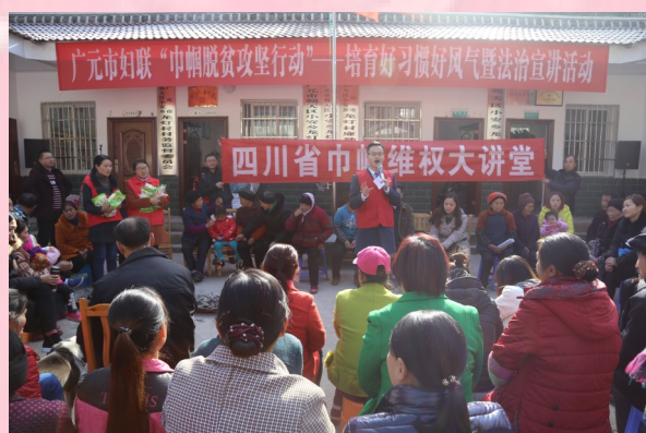
▲广元市妇联组织幸福使者深入贫困村开展“好习惯、好风气”培育宣讲活动