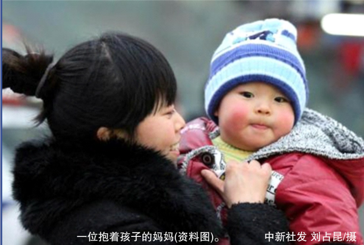
一位抱着孩子的妈妈(资料图)。