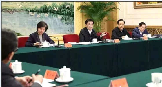
1月13日，全国总工会、共青团中央、全国妇联、中国科协、中国侨联5家群团组织班子成员会议在北京召开，中共中央政治局常委、中央书记处书记王沪宁出席会议并讲话。