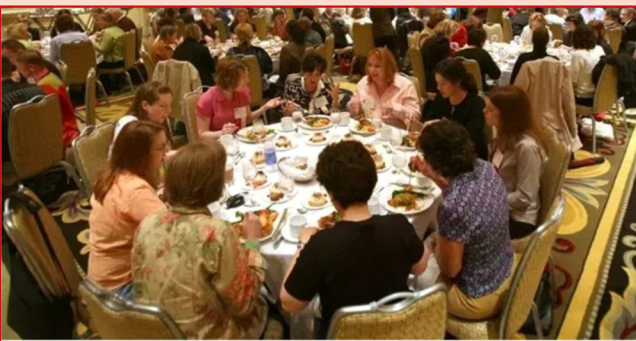
美国新闻工作者与作家协会年会上女性云集