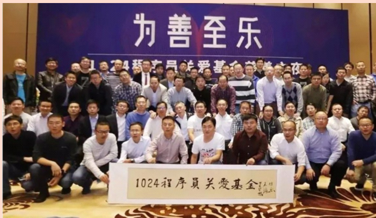
典型的程序员群体合影